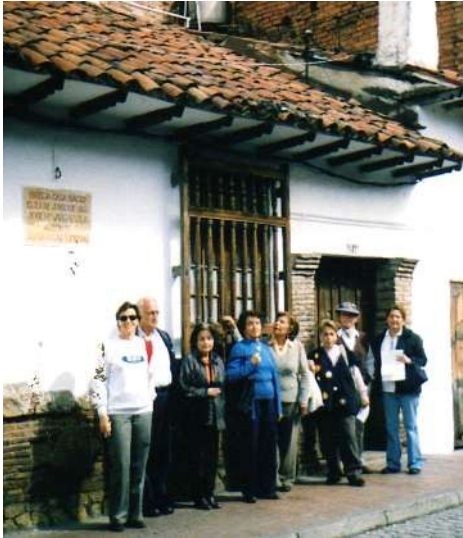
Visita-estudio casa de Vargas Vila