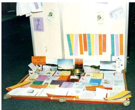
Instalación poética en FILBO